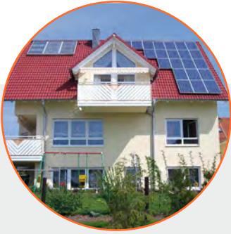
PV AM DACH

AB JETZT KOMMT WARMWASSER AUS PV-MODULEN!